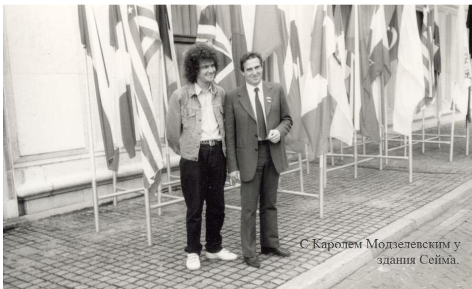
С Каролем Модзелевским у здания Сейма.